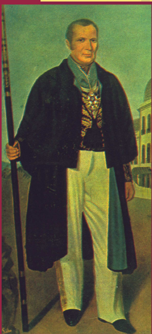
José Clemente Pereira Óleo sobre tela. Acervo do Museu Paulista - São Paulo, SP