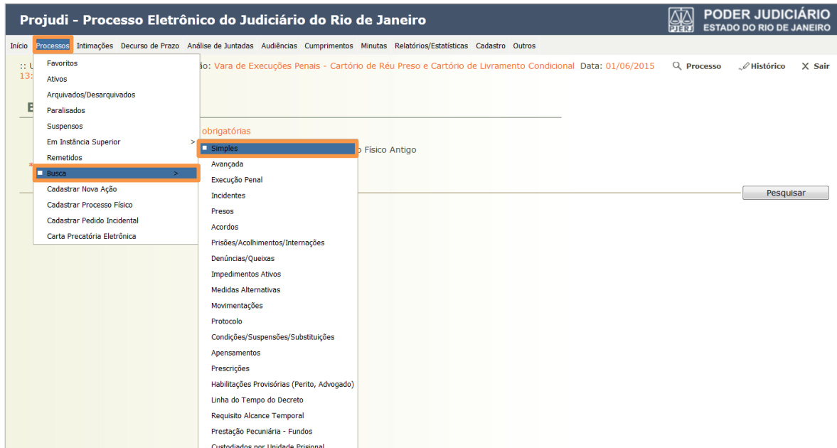
Figura 6 – Busca Simples

Acesse no menu Processos , Busca e na sequência Simple s.