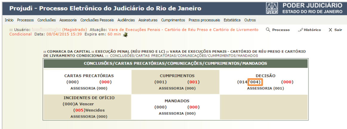
Figura 27 – Tela Decisão.

Para assinar uma decisão que teve a assinatura postergada, clique no indicador numérico à direita do número de decisões, que irá abrir a lista das decisões com assinatura pendente.