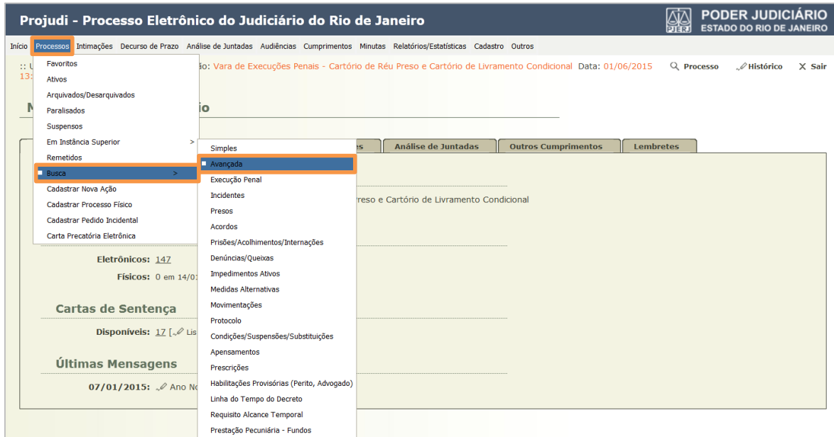
Figura 11 – Busca avançada.

Acesse no menu Processos , clique em Busca e na sequência, em Avançada .