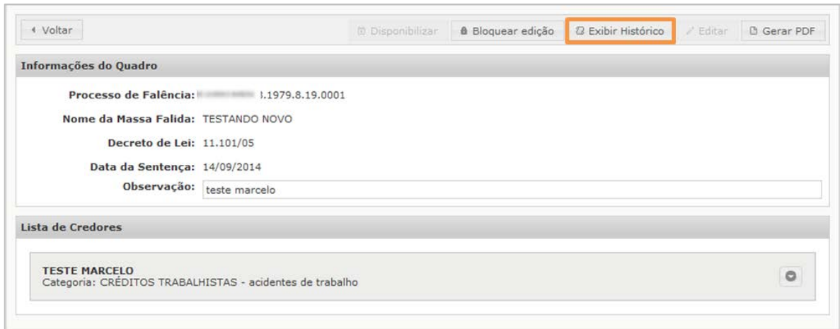
Botão de a funcionalidade Exibir Histórico

Funcionalidade que permite que um usuário visualize o histórico de alterações de um Quadro Geral de Credores.