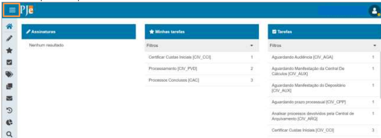
Figura 1 - Menu do PJE

Para distribuir um processo , clique no Menu do Painel do Usuário , localizado na parte superior esquerda da tela.