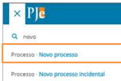
Figura 4 - Pesquisa

OBSERVAÇÃO: Também é possível digitar Novo no campo de pesquisa. Dentre as sugestões exibidas, selecione Processo . Novo Processo