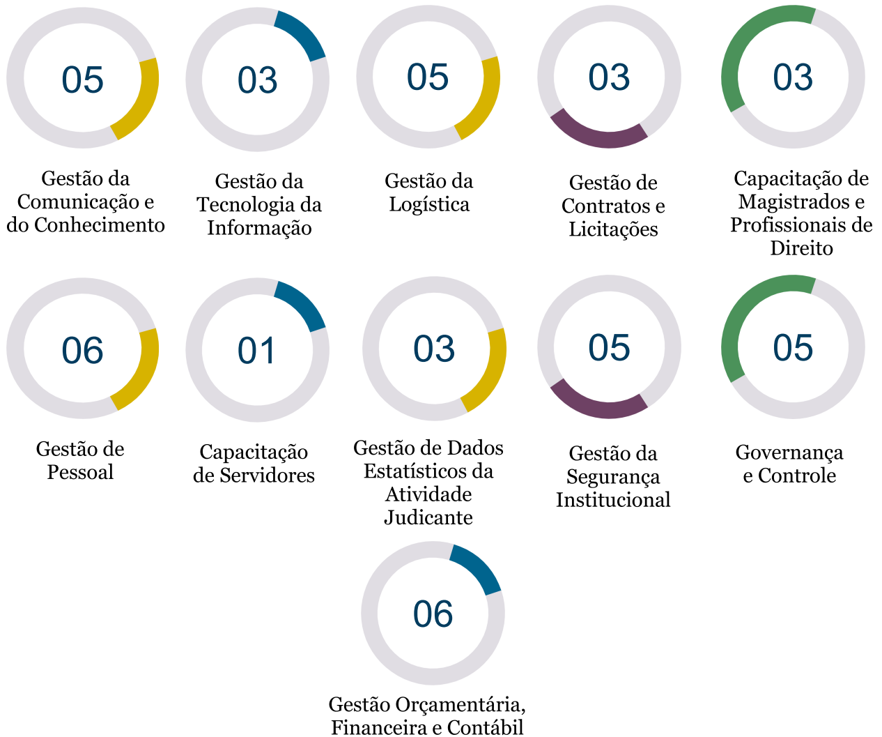
[GRÁFICO 1] Distribuição dos Macroprocessos por área temática