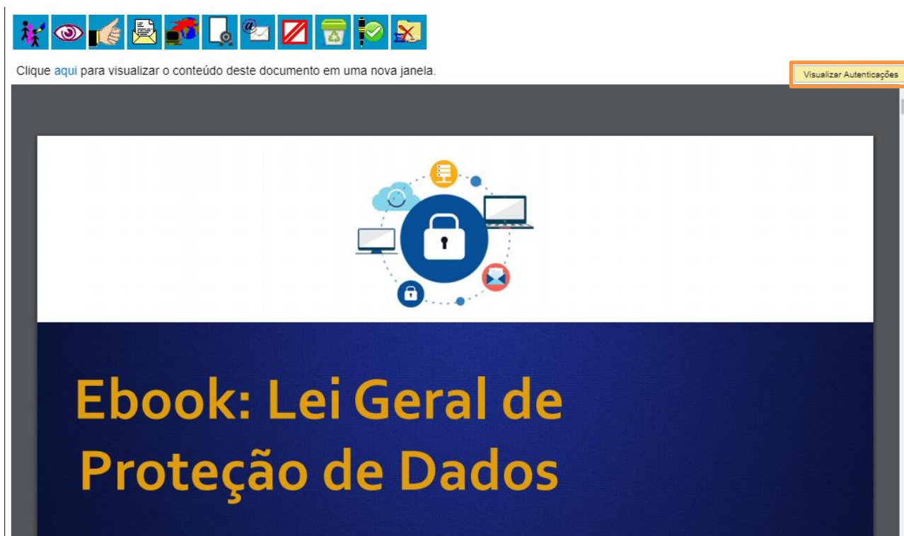
Figura 4 – Botão Visualizar Autenticações.

Na tela do documento também é possível visualizar detalhes da autenticação clicando em Visualizar Autenticações .